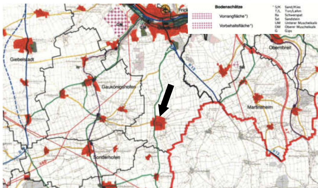
Abb. 3: Ausschnitt Karte Siedlung & Versorgung

Es befinden sich weder Vorrangflächen noch Vorbehaltsflächen für Bodenschätze im näheren Umfeld von Hopferstadt.