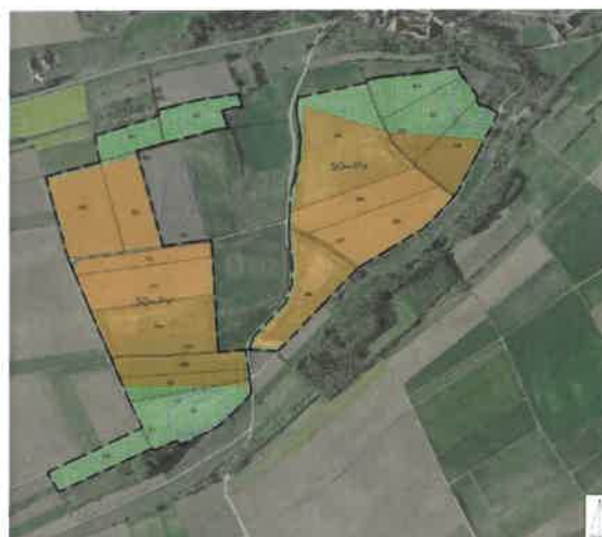
Lageplan ohne Maßstab (Fläche Süd)

Der Stadtrat der Stadt Ochsenfurt hat in seiner Sitzung am 25.03.2021 gemäß § 2 Abs. 1 BauGB den Aufstellungsbeschluss für den vorhabenbezogenen Bebauungsplan „Bürgersolarpark Darstadt“ in Darstadt gefasst. Der Aufstellungsbeschluss wird hiermit gemäß § 2 Abs. 1 Satz 2 BauGB bekannt gemacht.