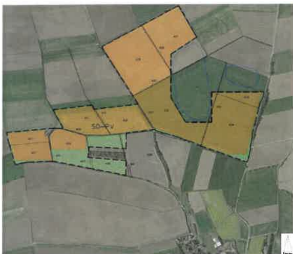
Lageplan ohne Maßstab (Fläche Nord)

Der Geltungsbereich der Flächennutzungsplanänderung umfasst die Fl.Nrn. 214, 262, 303, 304, 383, 404, 405, 406, 407, 408, 409, 410, 426, 429, 431, 432, 433, 434, 435, 440 (TF), 220, 221, 230, 231, 232, 233, 234, 235, 236, 237, 238, 239, 256, 257, 258, 259, 260, 264, 265, 266, 302, 306, 401, 402, 403, 411 und 425 der Gemarkung Darstadt mit einer Fläche von ca. 78,3 ha.