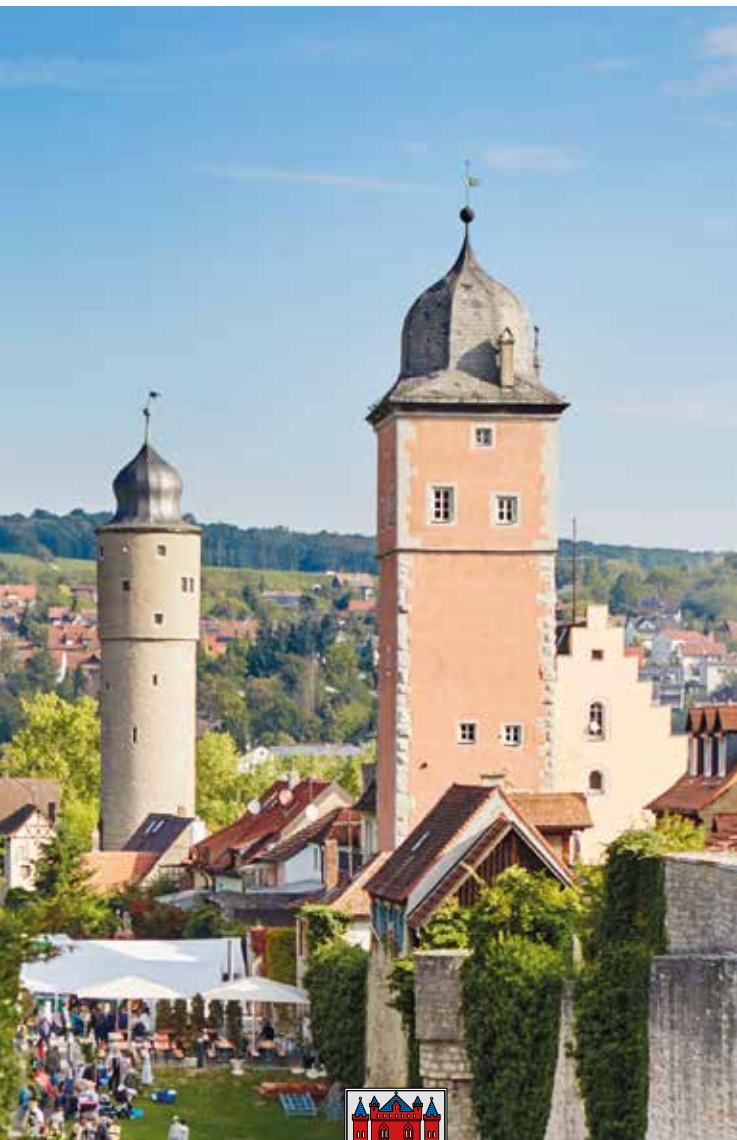
© Stadt Ochsenfurt 11/2024, Design: Konrad Grimm, Dipl. Designer (FH), Fotos: Stadt Ochsenfurt, Konrad Grimm