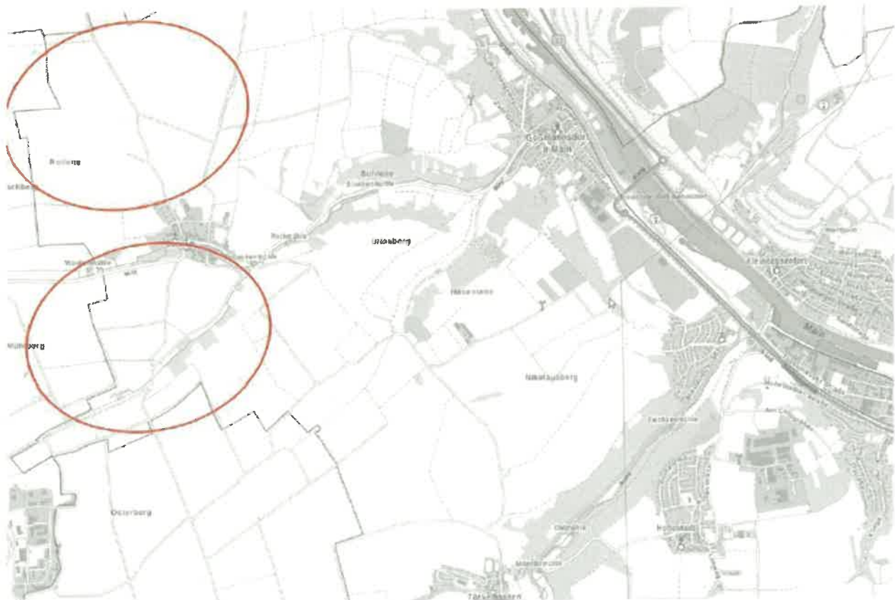
Übersichtsplan ohne Maßstab

Der Geltungsbereich liegt im westlichen Stadtgebiet von Ochsenfurt (Landkreis Würzburg, Regierungsbezirk Unterfranken) und besteht aus zwei Teilgebieten (Nord und Süd – im Folgenden Teilgebiet Nord und Teilgebiet Süd benannt). Er weist einen Gesamtflächenumfang von 75,25 ha auf. Das Teilgebiet Nord mit 45,23 ha (40,0 ha Sondergebiet und 5,23 ha Eingrünung) umfasst die Flurstücke mit den Fl.Nrn. 383 TF, 401, 402, 403 TF, 404 TF, 405 TF, 406 TF, 409 TF, 410 TF, 411, 425, 426, 429, 431 TF, 432 TF, 440 TF, 433 TF, 434, 435 TF, alle Gemarkung Darstadt. Das Teilgebiet Süd mit 30,02 ha (20,8 ha Sondergebiet und 9,22 ha Eingrünung) umfasst die Flurstücke mit den Fl.Nrn. 302, 303 TF, 304 TF, 306, 239, 238, 237 TF, 230-236, 221, 256-260, 262 TF, 264-266, alle Gemarkung Darstadt.