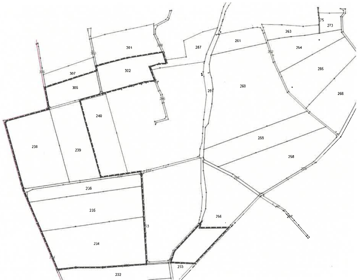
Lageplan Teilgebiet Süd ohne Maßstab