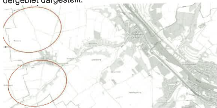
Übersichtsplan ohne Maßstab

Der Geltungsbereich liegt im westlichen Stadtgebiet von Ochsenfurt (Landkreis Würzburg, Regierungsbezirk Unterfranken) und besteht aus zwei Teilgebieten (Nord und Süd – im Folgenden Teilgebiet Nord und Teilgebiet Süd benannt). Er weist einen Gesamtflächenumfang von 41,4 ha auf. Das Teilgebiet Nord mit 29,4 ha umfasst die Flurstücke mit den Fl.Nrn. 383 TF, 426, 429 TF, 431 TF, 432 TF, 440 TF, 433 TF, 434 TF, 435 TF alle Gemarkung Darstadt. Gegenüber der 12. Änderung wird für die Flurnummern 408 und für die Teilflächen 404 TF, 405 TF, 406 TF, und 407 TF Flächen für die Landwirtschaft und nicht mehr Sondergebiet dargestellt. Das Teilgebiet Süd mit 12,1 ha umfasst die Flurstücke mit den Fl.Nrn. 302, 303 TF, 304 TF, 306, 239, 238, 237 TF, 234, 235, und 236 TF, alle Gemarkung Darstadt. Gegenüber der 12. Änderung wird eine Teilfläche der Flurnummer 256 als Fläche für die Landwirtschaft und nicht mehr als Sondergebiet dargestellt.